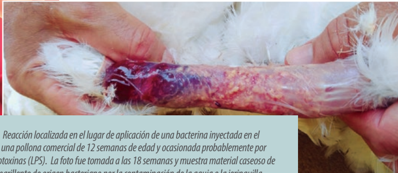
Foto 1. Reacción localizada en el lugar de aplicación de una bacterina inyectada en el cuello a una pollona comercial de 12 semanas de edad y ocasionada probablemente por las endotoxinas (LPS). La foto fue tomada a las 18 semanas y muestra material caseoso de color amarillento de origen bacteriano por la contaminación de la aguja o la jeringuilla.

Por otro lado, las reacciones en el lugar de aplicación son muy importantes por los decomisos a nivel de mataderos, sobre todo al usar emulsiones de aceite. Una recomendación por parte de las compañías de biológicos y líneas genéticas que nos ilustra la importancia de las endotoxinas al momento de vacunar, es mantener las vacunas a una temperatura promedio de aproximadamente 37 °C porque el sobrecalentamiento provoca la liberación de las endotoxinas que contiene la suspensión vacunal . La liberación de endotoxinas presentes en la vacuna provoca reacciones severas y mortalidad y puede causar un síndrome hemorrágico.