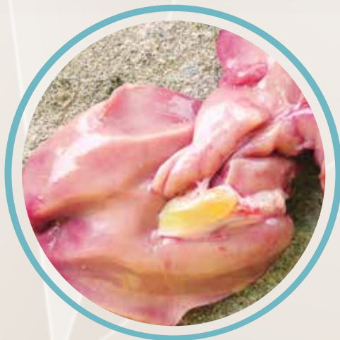
Pollos de 28 y 32 días de edad con bilis.

Generalmente la aflatoxicosis puede causar este tipo de lesión como consecuencia de los daños producidos en el hígado, que deteriora su capacidad de producir sales biliares de una concentración adecuada.